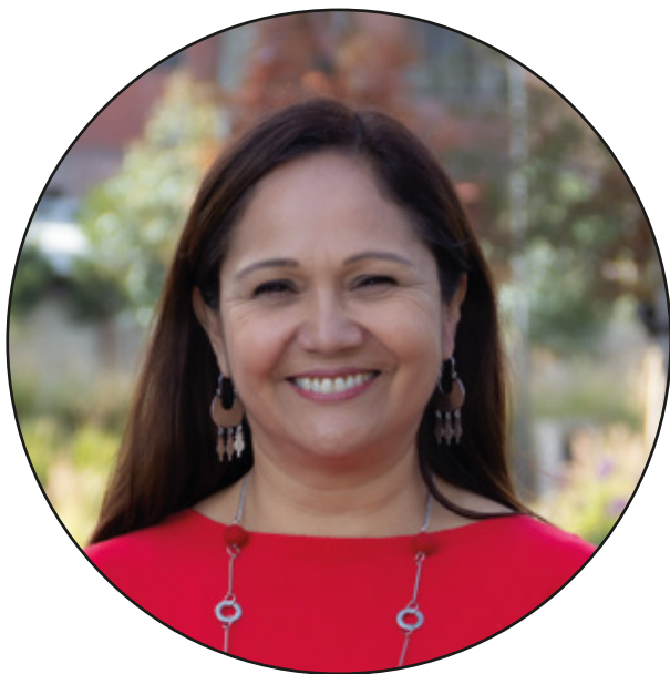
Verónica Figueroa Huencho Subsecretaría de Educación Superior

Verónica Figueroa Huencho , subsecretaria de Educación Superior, releva en esta entrevista los principales ejes del trabajo entre el Estado y las universidades estatales, y del importante rol que IESED-CHILE cumple en este proceso.